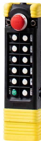
SAGA1-K3 / K4 TX