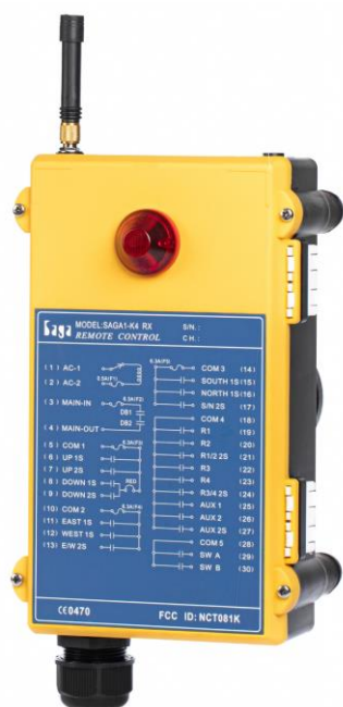
SAGA1-K3 / K4 RX