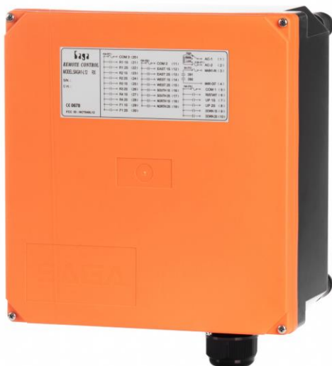
SAGA1-L12 / L12-1 RX