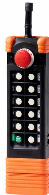
SAGA1-L12 / L12-1 TX